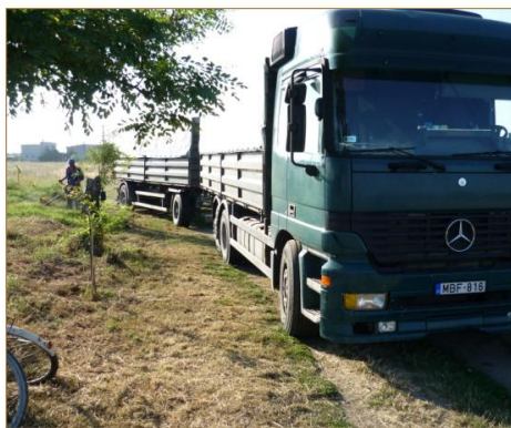
מאטריאל פאר'ן גדר קומט אן צום ביה"ח