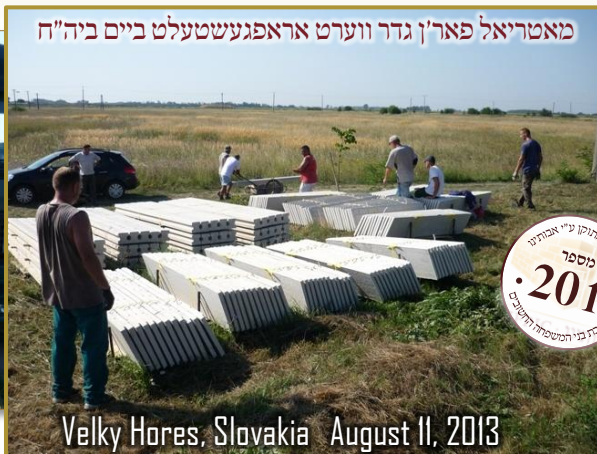
מאטריאל פאר'ן גדר ווערט אראפגעשטעלט ביים ביה"ח