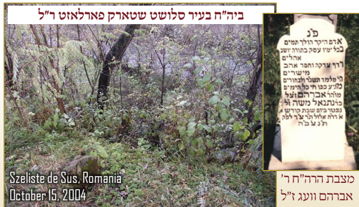
ביה"ח בעיר סלושט שטארק פארלאזט ר"ל